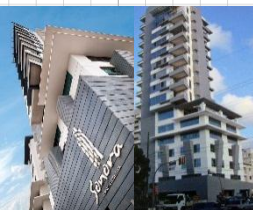
Preparado por Alexander Ramos